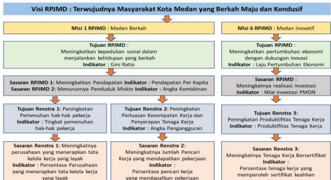
Gambar 4.2.1 Keterkaitan antara Visi, Misi, Tujuan, dan Sasaran RPJMD Kota Medan dengan Tujuan dan Sasaran Renstra Dinas Ketenagakerjaan Kota Medan 2021-2026 (Sebelum Perubahan)

Rencana strategis perangkat daerah dalam hirarkinya harus mendukung upaya perwujudan Visi dan Misi Kepala Daerah terpilih. Hal tersebut dikarenakan Rencana Strategis Dinas Ketenagakerjaan Kota Medan merupakan wujud operasional dari RPJMD Kota Medan, sehingga tujuan dan sasaran Renstra harus selaras dan mendukung pencapaian tujuan dan sasaran RPJMD. Keterkaitan antara visi, misi, tujuan, dan sasaran RPJMD Kota Medan 2021-2026 dengan tujuan dan sasaran Renstra Dinas Ketenagakerjaan Kota Medan 2021-2026 sebelum dan setelah perubahan Renstra adalah sebagai berikut :